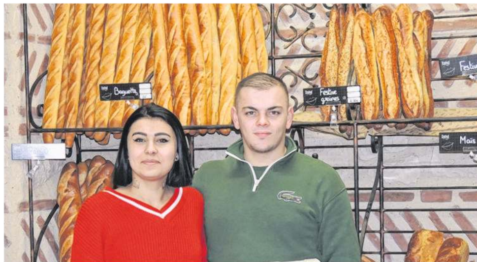
Jeunes et motivés, ils redonnent le sourire aux semurois sc

Effectivement âgés de 23 et 21 ans, ils démontrent à la motivation ne dépend pas du nombre d'années. « La fermeture n'aura finalement duré qu'un mois, une chance. Les